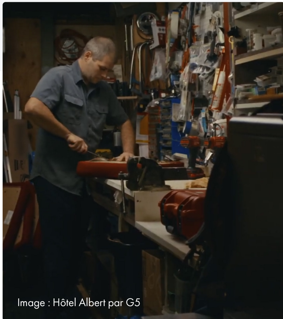
Image : Hôtel Albert

Plusieurs éléments sont à considérer afin d'adopter de bonnes pratiques dans le choix des fournisseurs. Ceux-ci sont résumés dans le tableau ci-dessous.