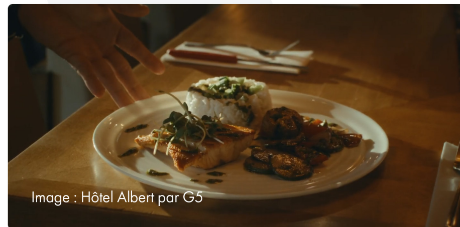
Image : Hôtel Albert